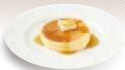
シングルパンケーキ Single pancake (パンケーキ1枚) ¥500 ( ¥550 )