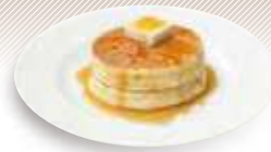
大江ノ郷パンケーキ Oenosato pancake (パンケーキ2枚) ¥880 ( ¥968 )